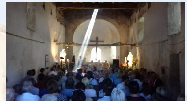
Célébration de la messe tous les ans au 15 août